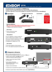
Nota sulla manutenzione

Si prega di contattare il proprio rivenditore EDISION per ulteriore servizio e assistenza tecnica.